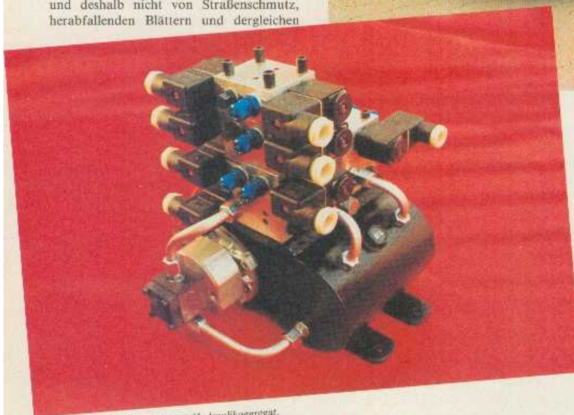
Das Herz der Anlage: Mikro-Hydraulikaggregat.

kann das Cabrio in einen Targa verwandelt werden. Diese Stellung ist besonders an heißen Sommertagen sehr nützlich, da man die Höhe, um die das Targadach über die Windschutzscheibe hinausragt, elektrohydraulisch einstellen kann. Mittels dieser Lösung ist es möglich, besonders bei lang-