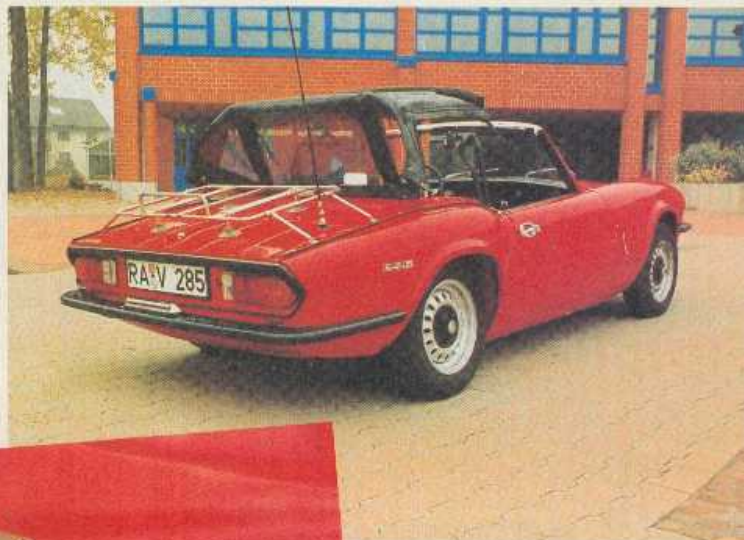
Auch das ist möglich: hydraulisch arretierbare Targa-Stellung.

Eine weitere Verwendungsart stellt die „Targa-Stellung“ dar. Per Knopfdruck