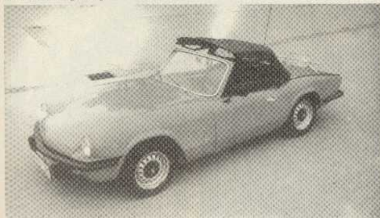
...das Verdeck selbsttätig geschlossen und verriegelt. Natürlich schließen auch die Seitenscheiben automatisch.

samen Fahrern oder bei Fahrten im Stadtverkehr die ideale Frischluftzufuhr einzustellen. Aber auch bei hohen Geschwindigkeiten kann mit „Targa-Stellung“ gefahren werden.