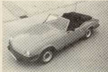
Aus der Ausgangslage...