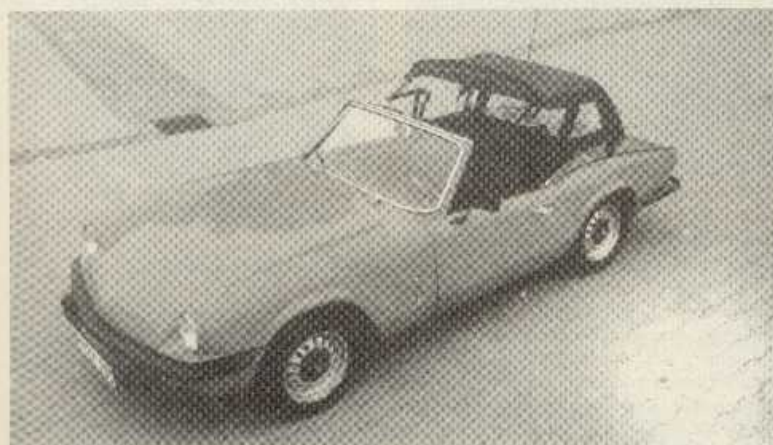
...wird über die Targastellung...