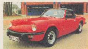
Die Mühsal der manuellen Betätigung ist vorbei.